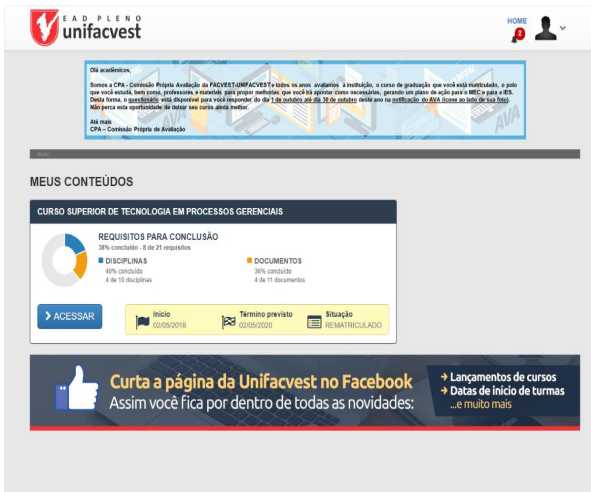
Figura 2 - Formulário – Convite para Participação do Processo Avaliativo