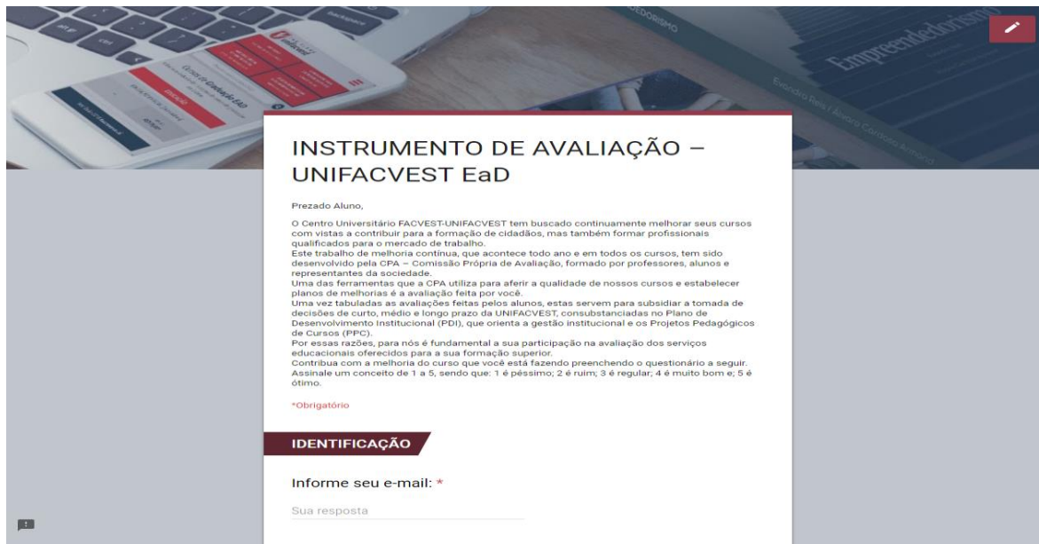
Figura 5 - Apresentação e Instrução do Preenchimento do ICD