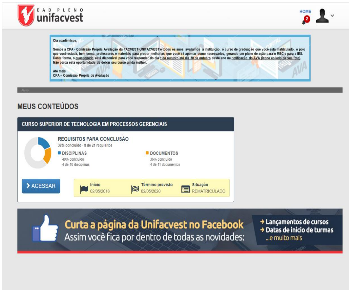
Figura 2 - Formulário – Convite para Participação do Processo Avaliativo