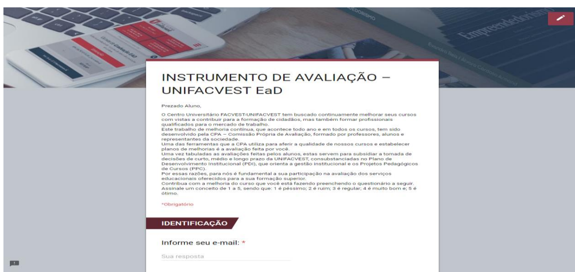
Figura 5 - Apresentação e Instrução do Preenchimento do ICD